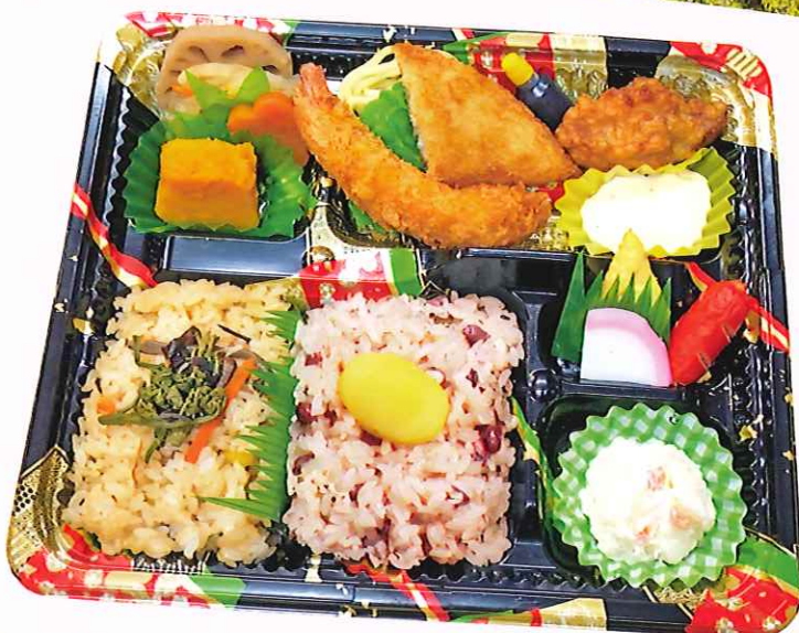
2 238mm × 202mm 吉野ヶ里弁当 税込 840円