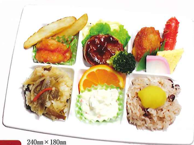
1 240mm × 180mm 弥生弁当 税込 650円