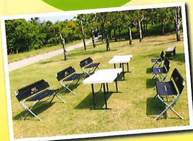
机や椅子、タープ(テント)の 追加貸出も可能!(200円~)