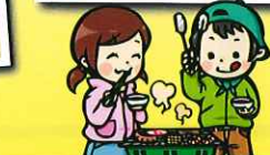
※詳しくは裏面をご覧ください