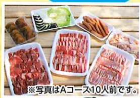
※写真はAコース10人前です。

食材、コンロ、 テーブル、 tong、火ばさみ、 炭、紙皿、紙コップ、BBQ 王 特選タレなどを用意