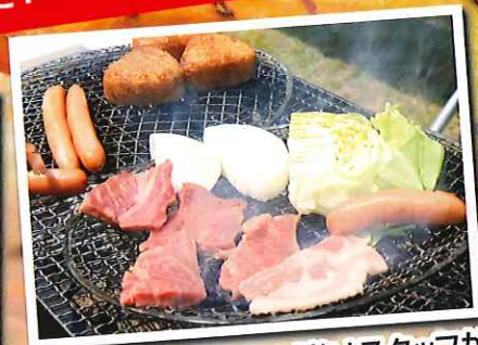
ボリュームたっぷり! スタッフが 安全に火起こしするので安心!